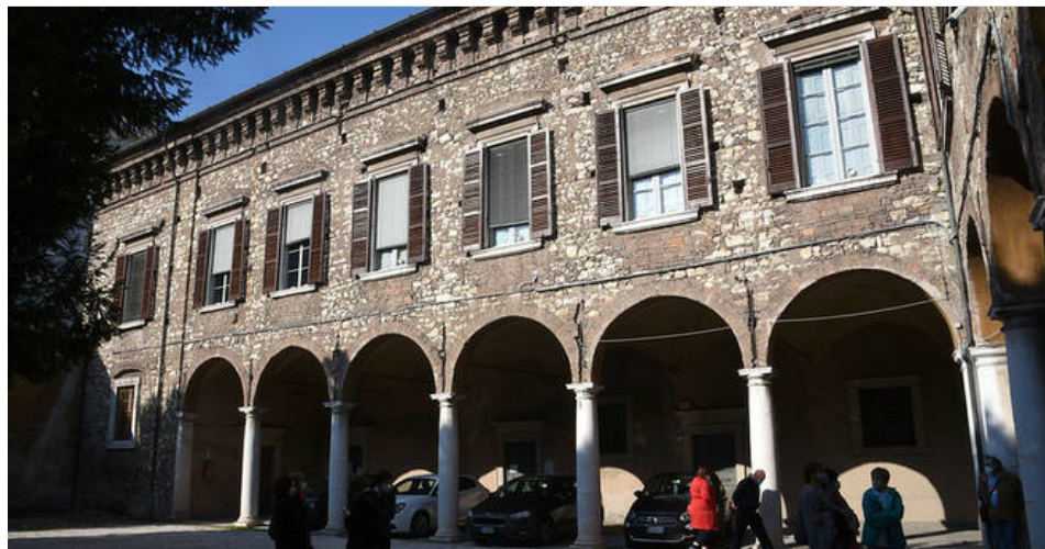
Interno Palazzo Martinengo delle Palle