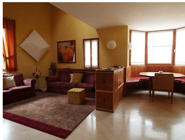
interno ristrutturazione casa Ramus in Edolo