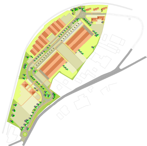
piano attuativo ex ferriera di Ceto