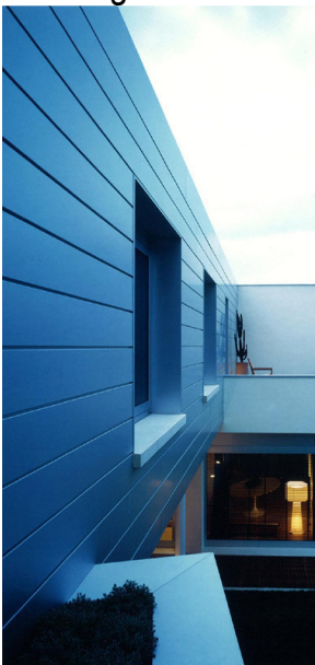
scorcio abitazione privata in Desenzano del Garda 2000

Dal gennaio 2006, mi occupo esclusivamente di gestione del lavoro e produzione in out-sourcing.